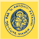
H. Antonius van Padua - Vianen